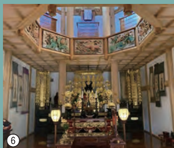
①山門 ②本堂正面 ③明和五年地蔵尊 ④鐘楼堂 ⑤三光堂正面 ⑥三光堂観音堂 ⑦三光堂護摩堂