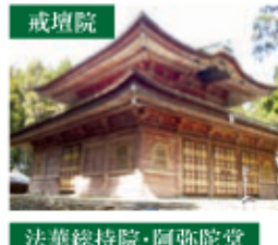
法華総持院・阿彌院堂

観院(現在の根本中堂)を創建し、自ら刻んだ法師如来像を安置して比叡山寺と号した。