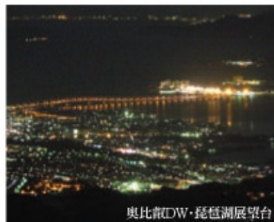
奥比叡DW・琵琶湖展望台