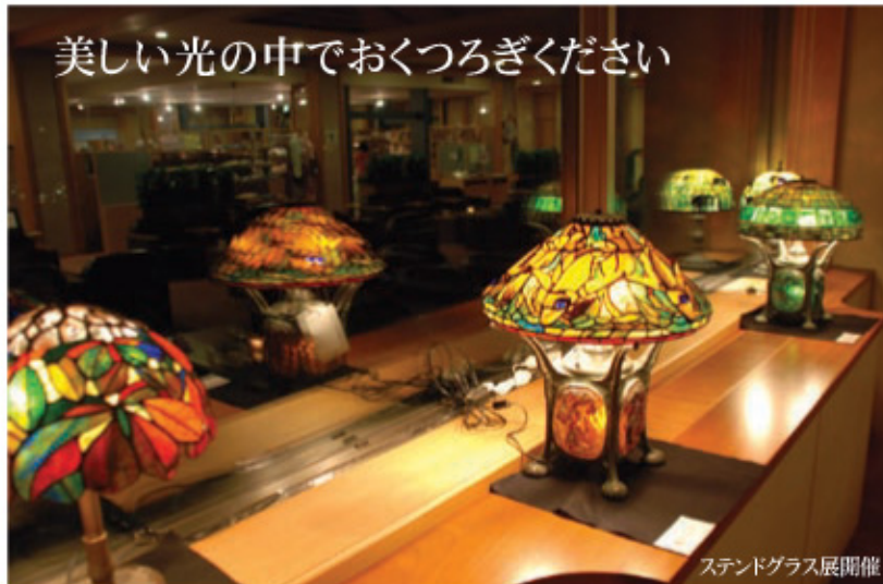
ステンドグラス展開催