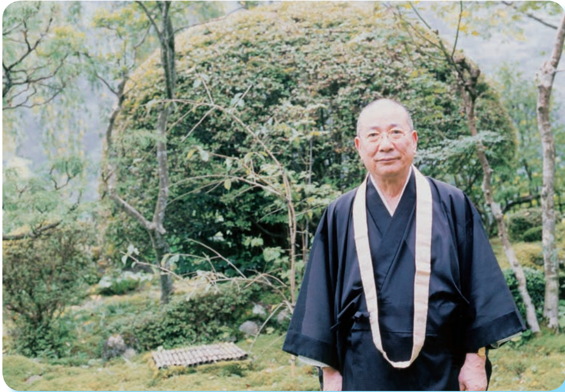
住職就任式(晋山式)は11月30日に。