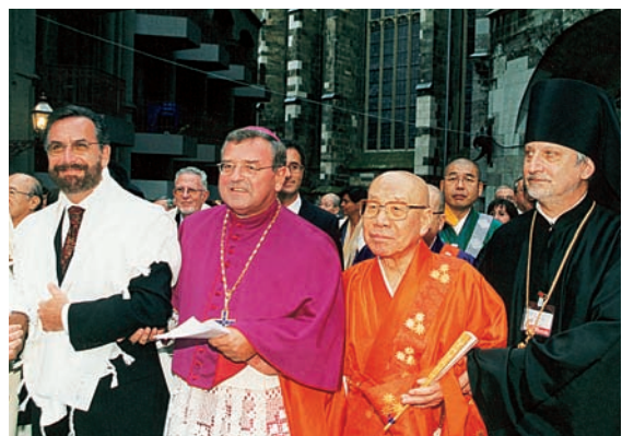
アーヘン市街地での平和の行進

ノーモア原爆を訴えたのは、前イスラエル首長ラビのイスラエル・メイール・ラオ師である。ラオ師は今