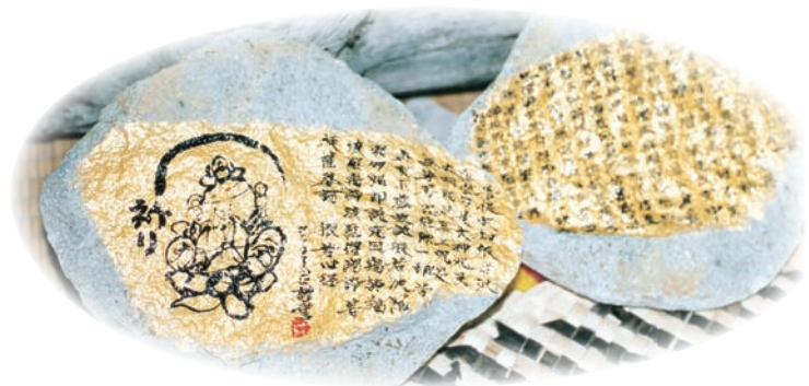
石に書いた般若心経