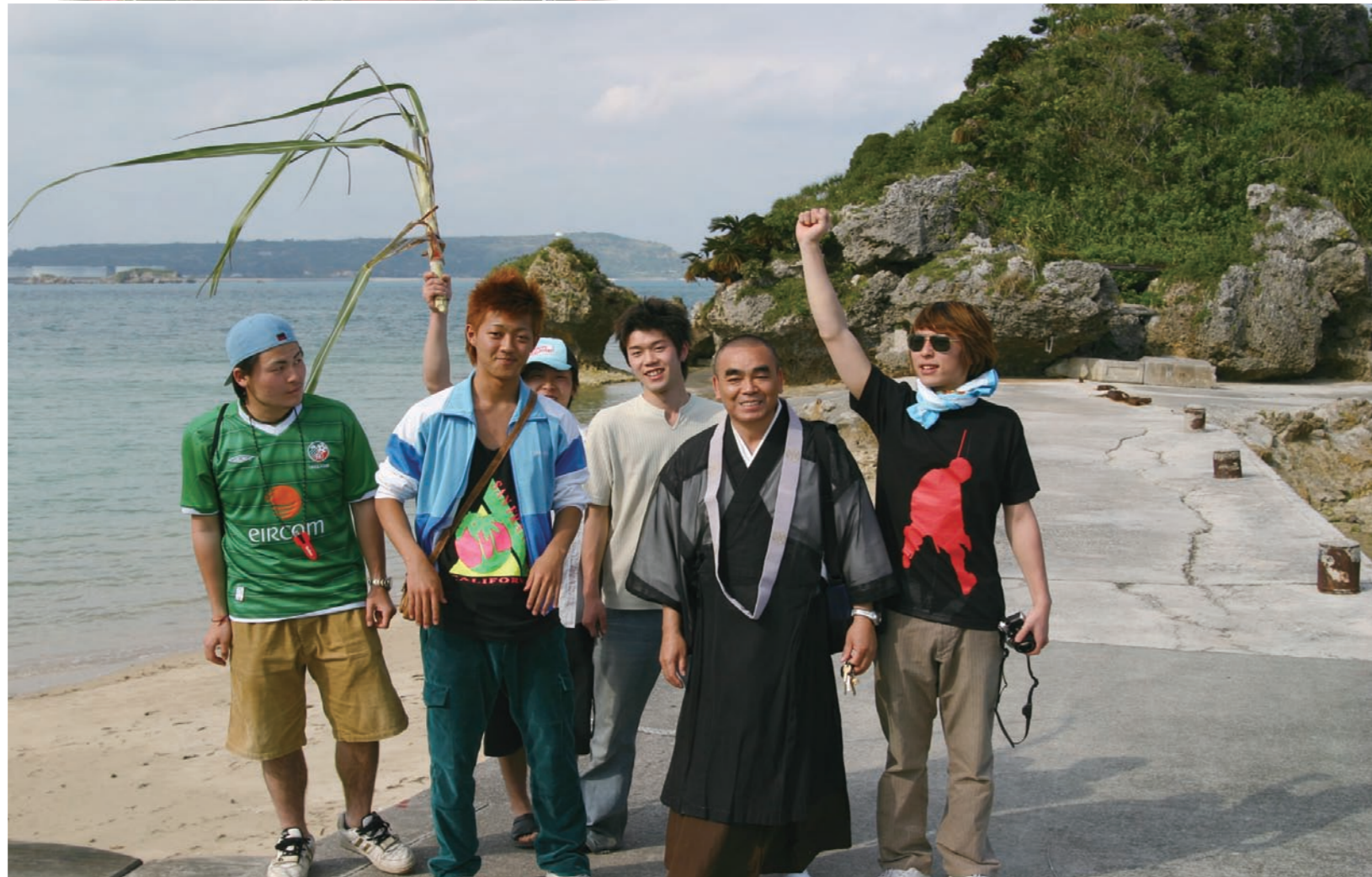
本土から遊びに来ていた若者たちに「サトウキビは、もっと下の方を食べないとまくなよ」と声をかけた。いかにも当世風の人たちとも、自然体でコミュニケーションする。右後に見える岩森はアマミチューの墓

決意を固めるために、彼は齋場御嶽に出かけて祈念したのだ。そこは、かつては、王といえども入ることを許され