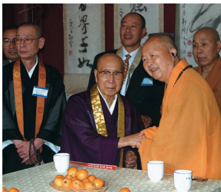
五年ぶりの旧交を暖めあう渡邊座主と可明住持。日中友好の絆は更に固くー。

迎えを、更に杭州では浙江省宗教局や旅游局要人らの熱烈な歓迎を受けた。今回の訪中団は、平成十一年の華頂講寺落慶以来。この五年間で中国は急速な発展を遂げており、ビルの建設ラッシュや高速道路の拡充整備などの変遷に、座主猥下も感嘆されることしきりであった。